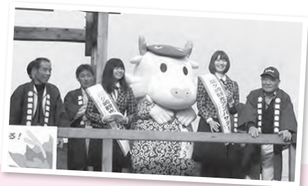
餅まきしたよ〜ん! ー商業祭り「いがっぺ市」・商店街大通りー

このコーナーでは、街で見かけたまいりゅうの目撃情報や、あなたの撮ったまいりゅうの写真、まいりゅうのイラストなどを募集します。コメントを添えて、りゅうほー編集室「まいりゅうを探せ」係 (☒ = koho@city.ryugasaki.ibaraki.jp) までお寄せください。