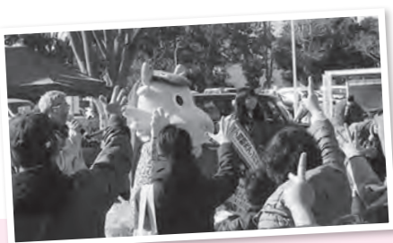
みんなとじゃんけんをしたよ〜ん! ーカガミクリスタルフェア・カガミクリスタルー