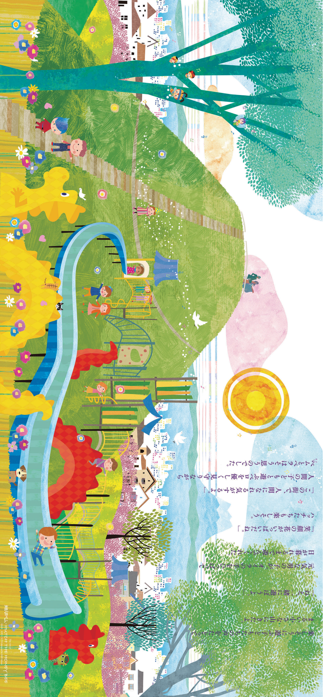
Illustration by HIRONOBY BEES

楽しんで遊ぼうと、山にきたよ。 「おえ、一緒に遊ぼうよ」 元気な男の子が、オオの手をさぐり、 日が暮れるまで遊んでくれた。 「笑顔の花がいつはだね。」 「ハチたちも楽しそう。」 「この街で、人間になれる気がするよ」 人間の子とも遊ぶ口を優しく見守りながら まともな考えで。