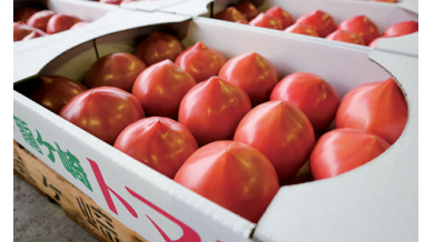
▲「龍ヶ崎トマト」特選品4kg箱

特選品4kg箱を数量限定販売／レディーファーストトマトの量り売り／ごほうびトマトや甘みのぎっしり詰まった中玉トマトも販売予定