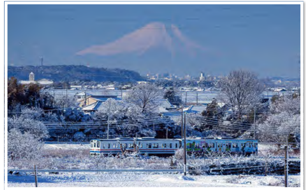
「雪の朝」吉澤さんからの投稿

雪の朝、踏切の音と気道車の音が聞こえ、眼下には竜鉄と富士山が雪の中に現れた。【1月7日・平台で撮影】