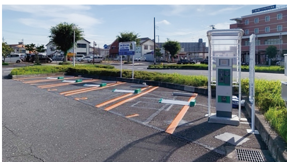
◀ コインパーキング

車での送迎の際は、コインパーキングをご利用いただき、龍ヶ崎市駅東口ロータリーの混雑緩和、事故防止のためにご協力をお願いします。