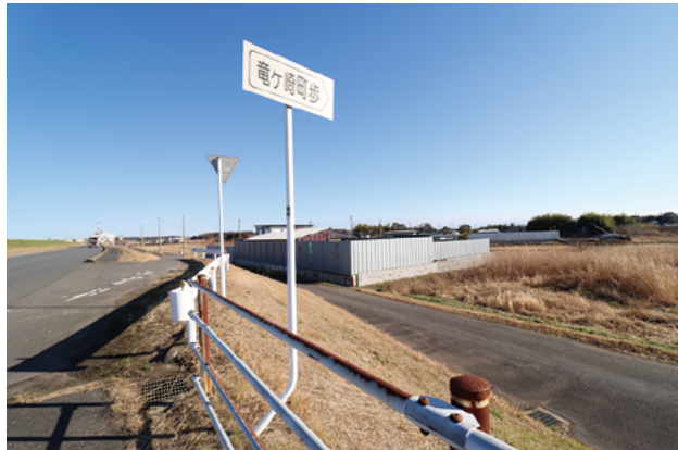
栄町の利根川堤防に設置されている標識

お隣の稲敷郡河内町や、利根川を挟んだ千葉県印旛郡栄町には、「龍（竜）ヶ崎」の名が付いている地域があります。その名も、「竜ヶ崎町歩」。