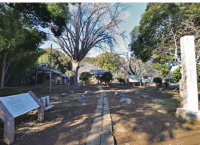
天から舞い降りた龍女が一夜にして建立したとされる「龍角寺」。建立当時は「龍閣寺」と呼ばれていたそうです

水を操る「龍神」を尊敬と畏怖の対象として、かつての人々は日々の営みに重ね続けたのでしょうか。