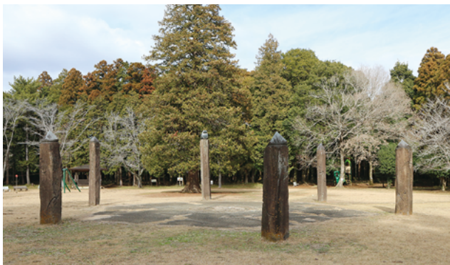
森林公園の「六方石」。中央のファイヤープレースでは、夏場は連日のようにキャンプファイヤーが行われていました