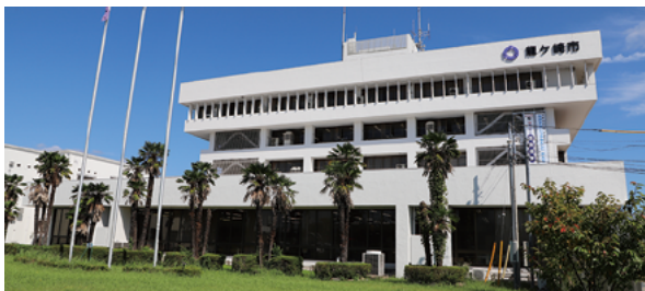
市役所庁舎の看板。市章は変わらず龍ヶ崎を見守っています