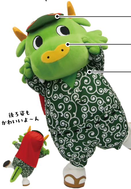
後ろ姿も かわいいよ～ん