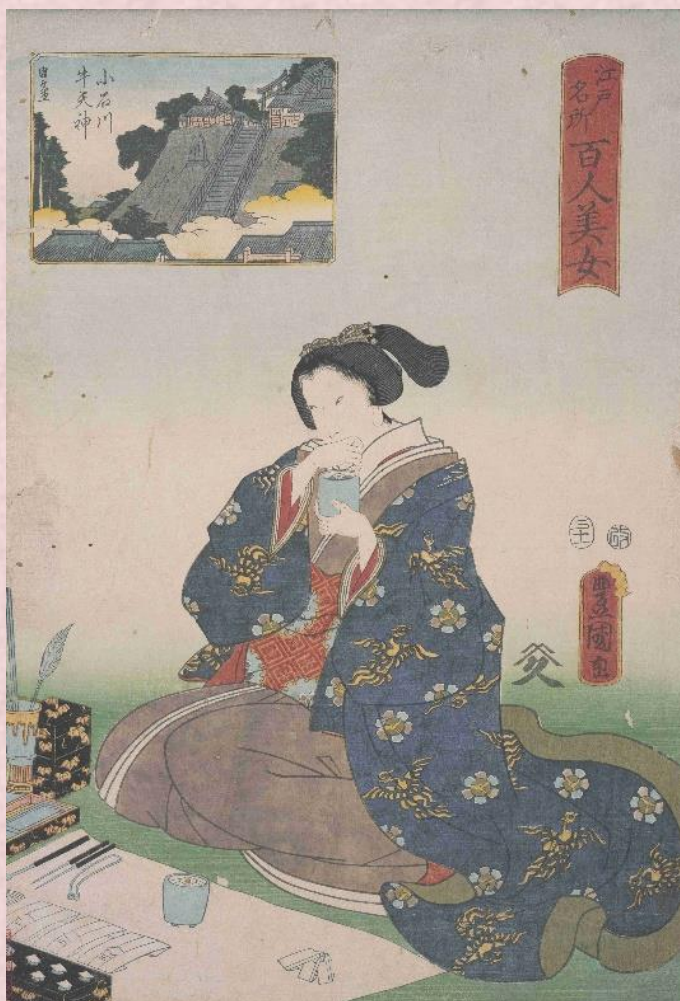
『江戸名所百人美女』「小石川牛天神図」