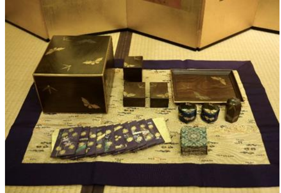
桑木地衝羽根(つくばね)蒔絵十種香箱

場所：龍ヶ崎市歴史民俗資料館 2階 多目的室 対象：小学生以上 定員：30人(事前申込制)