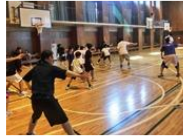
メインアリーナでの「バスケットボール ディフェンススキルアップレッスン」の様子