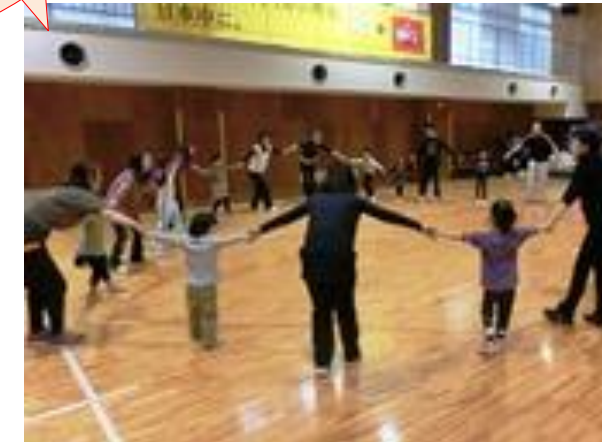
スタジオでの「親子ふれあいエアロビクス・ヨガ」の様子