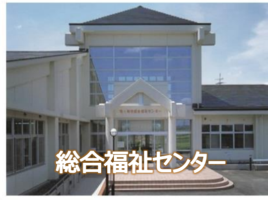
総合福祉センター