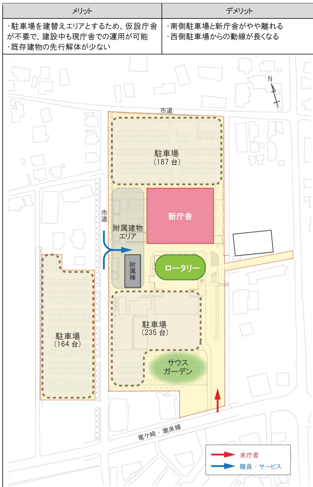
【案1】新庁舎を敷地中央部に配置（駐車台数：計586台）（S=1/2000）