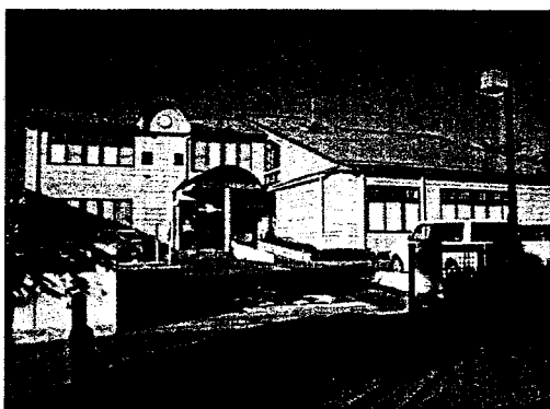
（駒馬台コミュニティセンター）