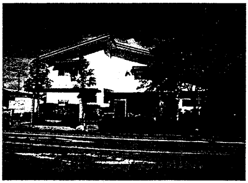
（松葉コミュニティセンター）