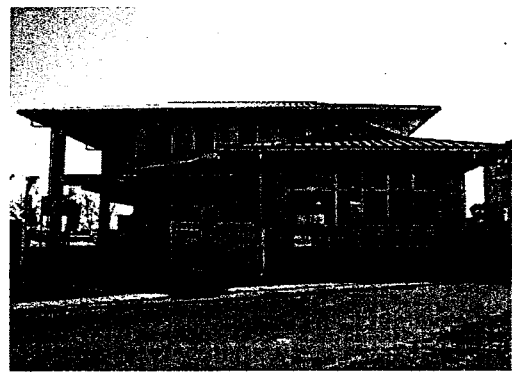
（大宮コミュニティセンター）