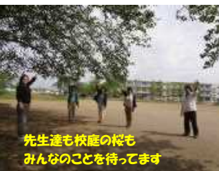
先生達も校庭の桜もみんなのこを待ってます

ホームページ上では、引き続き「先生からの応援メッセージ」を掲載しております。現在は、第2回目のメッセージを掲載中ですので、お子様と一緒にご覧ください。