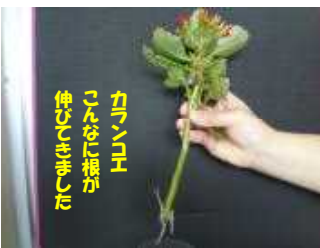
カラコエ こんなに根が 伸びてきました