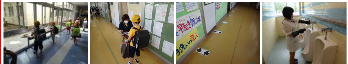
【登校時の手指消毒】