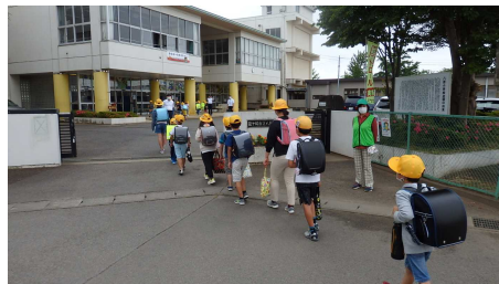
【6月8日の登校の様子】

今後、集団生活をする学校では、3密を避けるために様々な対策を講じる必要があります。毎朝の検温・手洗い・マスクの着用などはもちろんのこと、施設・用具の消毒も入念に行っていきます。また、教室での座席の配置や授業内容の工夫、給食時の新たなルールなど、新しい生活様式に変えていかなくてはなりません。保護者の方々にも、毎日登校前の検温と体調確認、マスクの用意など、ご苦勞をおかけすることとなりますが、ご理解・ご協力をお願いいたします。